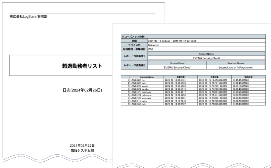
EVEMA の認証ログから作成した長時間勤務者の勤怠表 サービス残業や持ち帰り残業の把握に役立つ